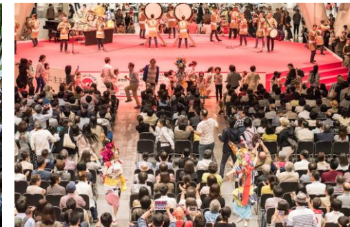
フォル・ニューイ(聴衆参加型イベント)