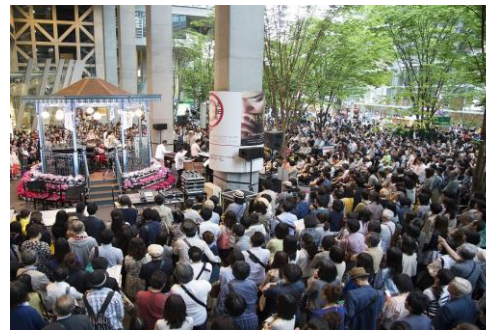
地上広場 キオスク(無料公演)ステージ