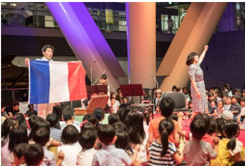
子どもたちの音楽アトリエ(ワークショップ)