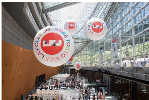
TIF ガラス棟内の会場装飾