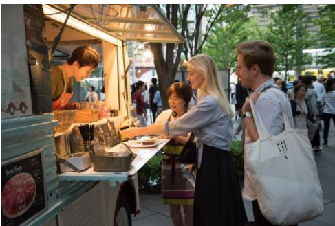
地上広場に多数展開するキッチンカー