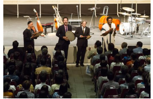
＜ホールA 0歳からのコンサート／ホールC ・ ホールB7等 多彩な有料公演の数々＞